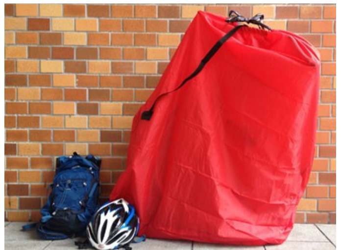
FERMER LE SAC AVCE LES CORDONS