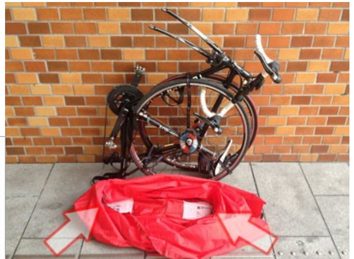
POSER LE SAC SENS INDIQUE