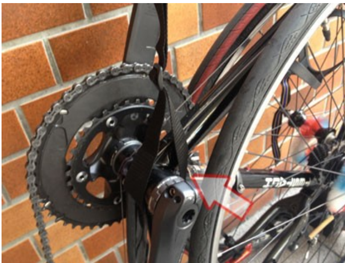
PASSER LA SANGLE D'EPAULE SUR LA MANIVELLE GAUCHE