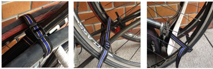
DEMONTER LA ROUE AVANT, ARRIERE. SANDOICHER ET FIXER AVEC 3 SANGLES