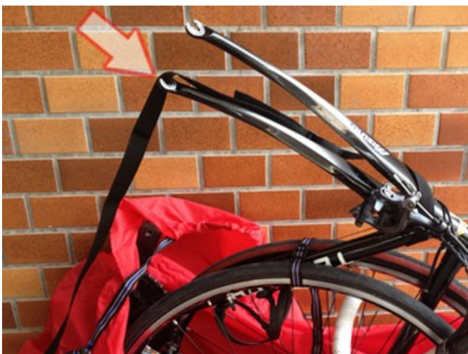
FIXER LA SANGLE SUR TÊ DE FOURCHE